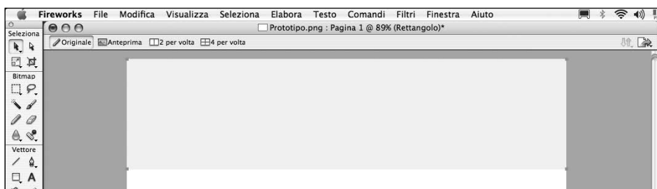
Figura 3.2 – Il rettangolo grande 800x600 pixel.

Ora ci dedicheremo alla creazione dell'header, ovvero della testata del sito. In genere questa è rappresentata da un rettangolo largo quanto tutta l'estensione del documento, sul quale viene creata una grafica particolare. Iniziamo quindi con il creare un rettangolo con l'apposito strumento Rettangolo presente nella barra degli strumenti. Attenzione però: questo strumento può assumere diverse configurazioni, per cui è necessario trattenere per qualche secondo il puntatore del mouse con il tasto premuto, per visualizzare un piccolo menu dal quale scegliere lo Strumento rettangolo . Ora si passa alla creazione di un rettangolo largo 800 pixel e alto 200. Per impostare i valori in modo preciso, si può disegnare il rettangolo velocemente sul documento, per poi inserire i valori numerici nelle caselle L: e A:, presenti nel pannello Proprietà . Ovviamente per fare questo il rettangolo deve essere selezionato. Il colore di base che assume il rettangolo è arbitrario e dipende dalla configurazione dell'utente.